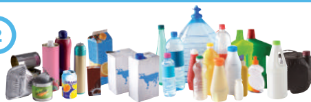
Emballages métalliques, briques alimentaires et emballages plastique (uniquement les bouteilles, bidons et flacons)

*Les nouvelles consignes de tri seront déployées sur les Communautés de Communes entre avril et décembre 2019. CC Thelloise (hors ex CC Ruraloise) • CC du Plateau Picard • CC du Clermontois • ex CC Rurales du Beauvaisis