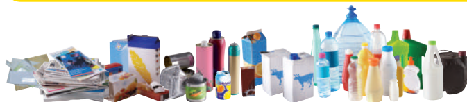
Papiers, emballages en carton, emballages métalliques, briques alimentaires et emballages plastique